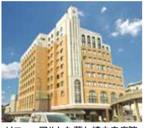
リニューアルした茅ヶ崎中央病院

茅ヶ崎中央病院では、訪問診療を行なっています。同院で日々、診療を行なっている現場の医師が、茅ヶ崎市とその周辺地域（平塚市の一部ほか）の住まいに定期訪問し、医療を提供しています。