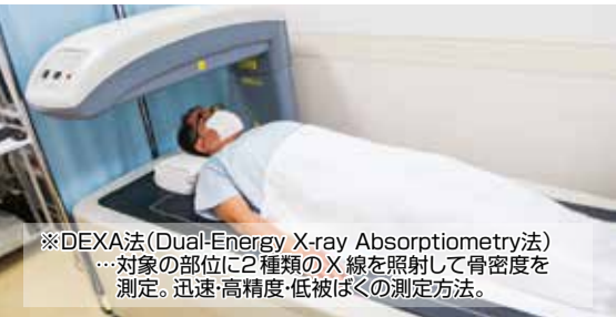
※DEXA法(Dual-Energy X-ray Absorptiometry法) 対象の部位に2種類のX線を照射して骨密度を測定。迅速・高精度・低被ばくの測定方法。

骨密度測定にDEXA法*(スマートファンビーム方式)を導入=湘南東部クリニックにて