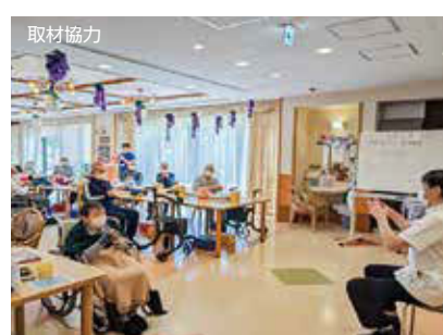
療法師(右)がリハビリを楽しく提供している

茅ヶ崎市からも藤沢市からもアクセスの良い「ふれあいの桜」は、介護老人保健施設に不自由を抱えて介護やリハビリを必要としている高齢者が、入所して支援を受けながら生活し、自宅で生活しながら定期的に通うことも、専門的になりハビリテーションや介護士による入浴などのサービスが受けられます。