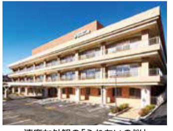
清廉な外観の「ふれあいの桜」

同施設のスタッフは、次のように話しています。「当施設では、二市に接している立地を活かし、入所だけでなく、ご自宅で生活している高齢の方が日中のお時間にお会いになって、ご自身のお体に必要なりハビリや介護を受ける「通所リハビリテーション」も提供しております。お通いの際、ご自宅への送迎サービスもご評判いただいております。