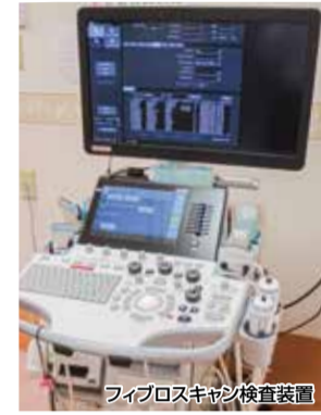
ファイブロスキャン検査装置

健康診断や人間ドックで、「脂肪肝」を指摘された方はいませんか？ 脂肪肝とは、肝臓に中性脂肪が蓄積し、肝細胞の30%以上が脂肪化した状態をいいます。肝臓は脂肪をつくり、それを肝細胞にためてエネルギーとしてつかう機能を持ちます。しかし、つかうエネルギーより脂肪が多くなると、肝臓にたまっていきます。これが脂肪肝です。肥満の方だけでなく、やせ型でも脂肪肝になるケースは珍しくありません。特に最近では、愛飲家ではないにもかかわらず脂肪肝を指摘される方が増えています。運動不足による筋肉量の減少も、一因ではないかと考えられます。