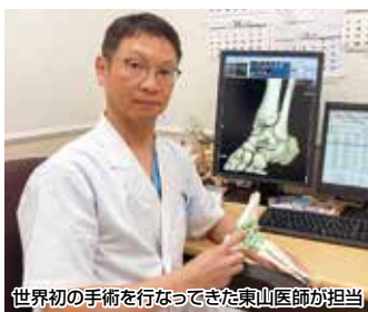
世界初の手術を行ってきた東山医師が担当

「は、二下肢スポーツ専門外来」がありすが、そちらで足首の痛みを相談することはできますか？