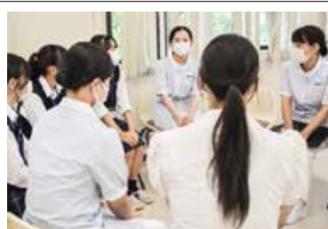
フランクな場で行なわれる座談会