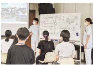
現役の看護学生からの説明も

茅ヶ崎看護専門学校では、入学希望者や看護に興味がある人を対象に、「入試説明会」を行なっています。同校のスタッフにお話を聞きました。入試説明会で扱う内容を教えてください。