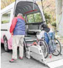
車椅子でも乗車できる送迎バス

Q. 透析治療の時間帯などを教えてください。 A. 月・水・金曜日は午前と午後の2クールを確保し、火・木・土曜日は午前の体制で行なっています。当クリニックでは、ご希望によって透析患者さまに昼食(有料)も提供しております。管理栄養士が監修しているため、透析患者さまでも安心して召し上がりいただけるメニューになっています。