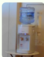
ウォーターサーバー