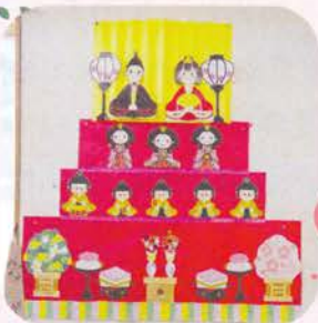
入院患者様の作業療法中の共同製作です。

職員一丸となり、患者様の「その人がその人らしい生活を送る」ことができるようサポートさせていただきます。