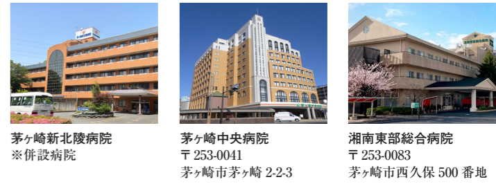
茅ヶ崎新北陵病院 ※併設病院 茅ヶ崎中央病院 〒253-0041 茅ヶ崎市茅ヶ崎 2-2-3 湘南東部総合病院 〒253-0083 茅ヶ崎市西久保 500 番地

緊急時には併設の病院や近隣のグループ病院で24時間365日、迅速に対応いたします